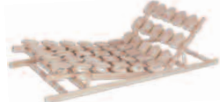
Sitz- und Fußhochstellung